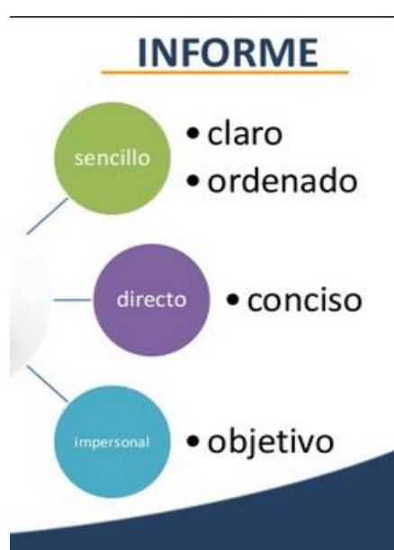
Características de un informe de fácil lectura y comprensión.