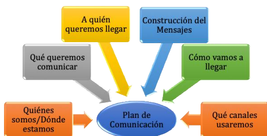
Elementos para construir un plan de acción.

La compatibilización de la práctica comunicativa con la propuesta de Plan de Acción elaborada deberá considerar varios momentos: en primer lugar, un proceso reflexivo al interior de cada EFS que corrobore los supuestos contenidos en la propuesta de Plan de Acción y los objetivos determinados para cada ámbito a desarrollar; en segundo lugar, definir las acciones particulares que se llevarán a cabo en concordancia con su planificación interna.