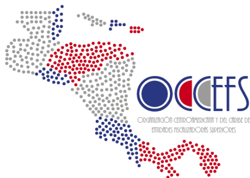
Logo OCCEFS: Versión 2

Logos que han recibido mayor votación del Grupo de Trabajo de Comunicación e Imagen, a presentar en AGO