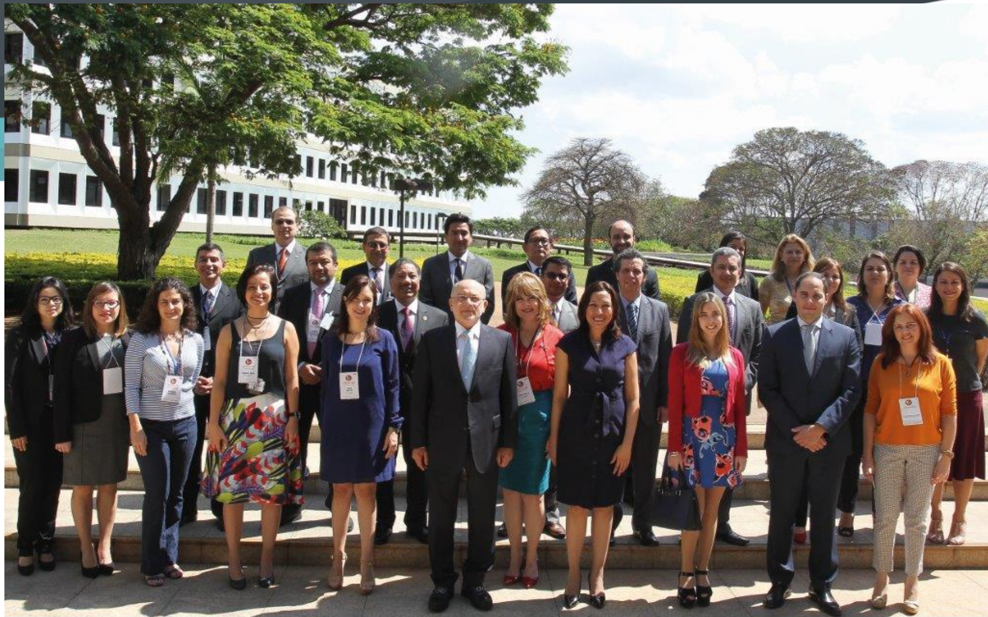
Taller de Innovación 28 a 30 de septiembre de 2016 – Brasilia, Brasil