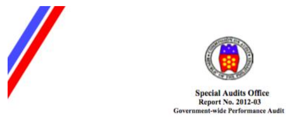
Priority Development Assistance Fund (PDAF) and Various Infrastructures including Local Projects (VILP)