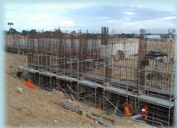
Fiscalización en el Aeropuerto de Fortaleza

De esta cifra, quince contratos se refieren a la elaboración, evaluación y actualización de proyectos básicos y ejecutivos.