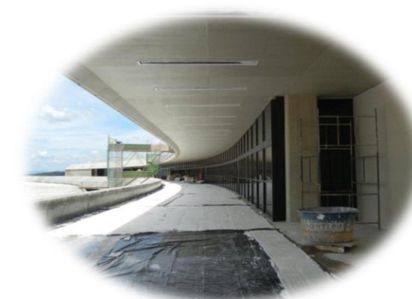
Fiscalización en el Aeropuerto de Confins

A pesar de que el TCU auditó estos emprendimientos durante los últimos años, no hubo ningún impacto en los plazos de las obras como resultado de las recomendaciones emitidas por esta Corte de Cuentas.